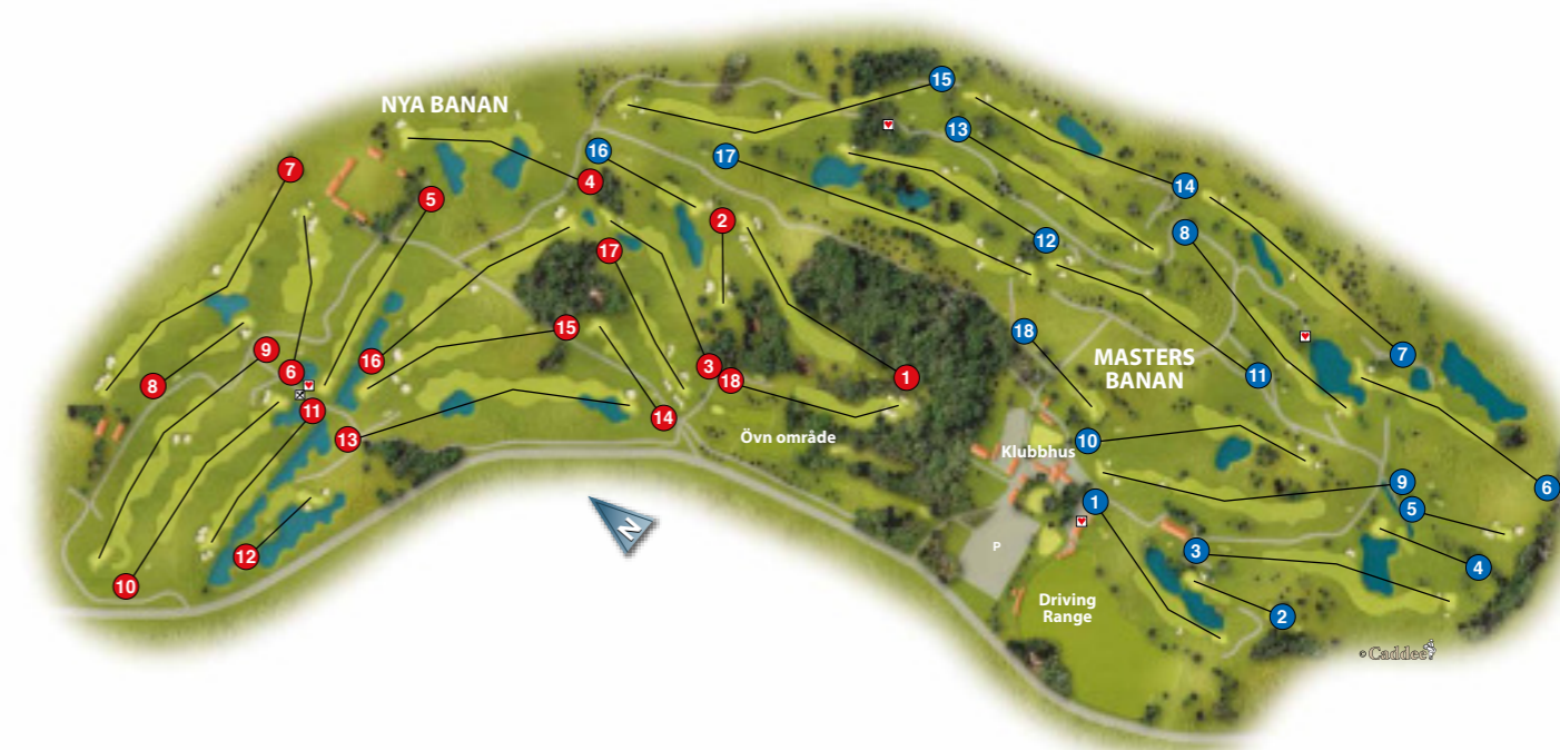
Grafik: Caddee Golf

”Masters Banan är en sund golfbana som stått värd för Europatouren vid inte mindre än två tillfällen. Inför dessa tävlingar gjordes flertalet justeringar av banans utformning. Med denna planen är målet att skapa en ännu bättre helhetsupplevelse där banan får en röd tråd genom sitt hela formspråk. Detta kommer att ske genom att göra en total bunkerrenovering. I arbetet föreslås justering av placeringar av bunkrar men mest av allt kommer dess nya utformning att märkas. Det blir mindre antal bunkrar som i sin utformning är mindre i storlek dock så räknar vi att de är ännu mer strategiskt placerade och kommer att påverka spelet mycket mer. Sedan tillkommer den estetiska effekt som sker av det formspråk vi valt. Sanden blir vitare och kanterna lite skarpare.”