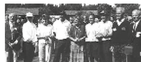
Idel prominenta invigningsgäster på plats.